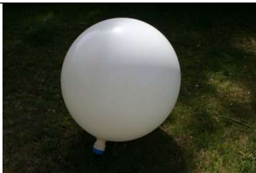
Riesenluftballon 80cm oder 100 cm