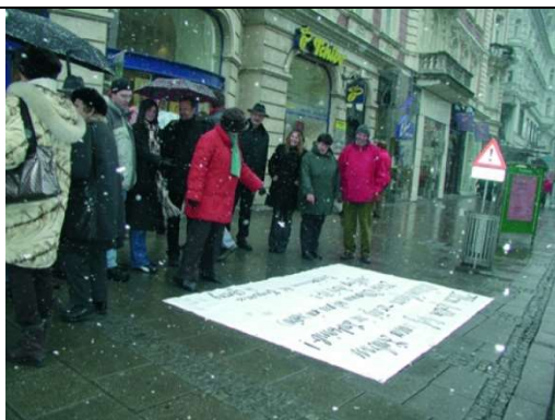
Bodenplakat mit Sütterlin beschriftet oder mit Kinderhand und RS-Fehlern