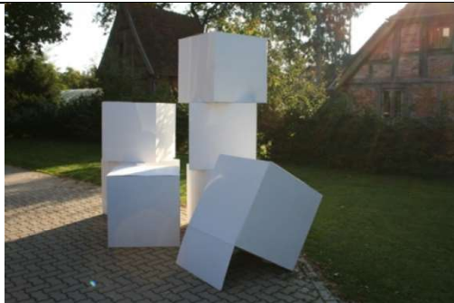
7 große weiße Kartons (80x80x80cm) für die eigene Beschriftung.

Sprühkreide in Rot, Gelb oder Weiß Die ideale Markierung für Symbole und Zeichen auf Rasenflächen und Pflastersteinen.