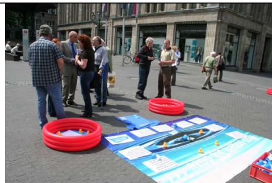
Damit nicht alles baden geht! Quietschenten und Planschbecken