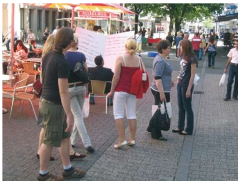
Riesenzeitung: 2 textilverbundene Pappen, je Seite 70 x 90 cm

(Aus W. Nawroth, Öffentlichkeitsarbeit als Dialog auf der Straße)