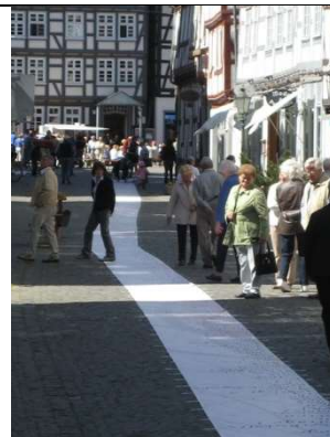
50 m - Textband – langen, langen Text im Laufen lesen