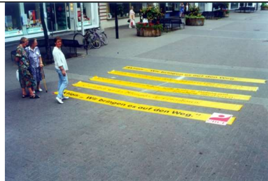
Themen-Zebrastrifen "Wir bringen es auf den Weg"